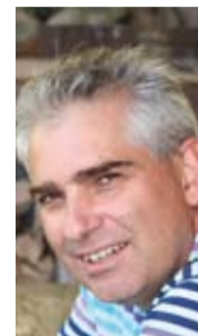
Ad Saris Voorzitter TVB

"Glasvezel zorgt voor integratie van tv en internet"